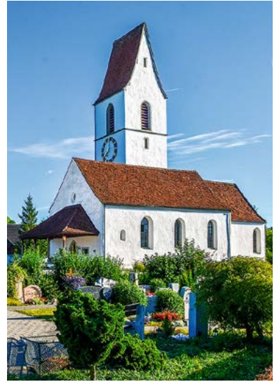
Zum Jubiläum der Marienkirche Bertiswil in Rothenburg (rechts) wird ein Freilichtspiel mit einem Gaukler (links) aufgeführt.