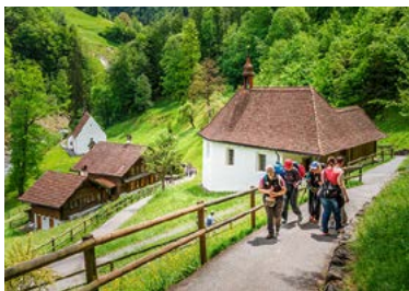
Anfang September pilgern die Luzerner:innen in den Ranft.